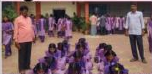
పోటీల్లో విజయం 19 వీరు లాభ్య : పల్నాటిలో ప్రథమ అంతుల సైబరాబ్బద్ పాఠశాలకు గ్రంథాలయ వారోత్సవాలకు ప్రోత్సహించేటగా విద్యార్థులకు గ్రంథాలయ అధికార వరసే దావజీ అర్చనలలో చిత్రలేఖనం పోటీలు అయి పోటీలు విద్యార్థులయారు. 172 అనేకమ గ్రంథాలయ వారోత్సవాల్లో అగ్రగా ఈ అర్చనలయారు. అందులో విజయం పొందారు.

గ్రంథాలయ వారోత్సవాల్లో... చిత్రలేఖనం పోటీలు